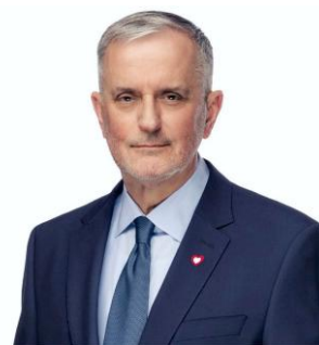
Zdjęcie 2: Roman Szełemej, Prezydent Miasta Wałbrzycha.