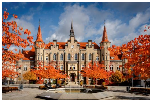
Zdjęcie 1: Ratusz.

Główną siedzibą Urzędu jest Ratusz przy Placu Magistrackim 1 w Wałbrzychu.